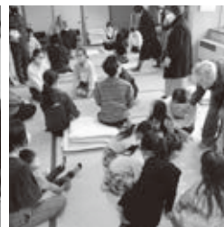
▲昨年度の受講風景